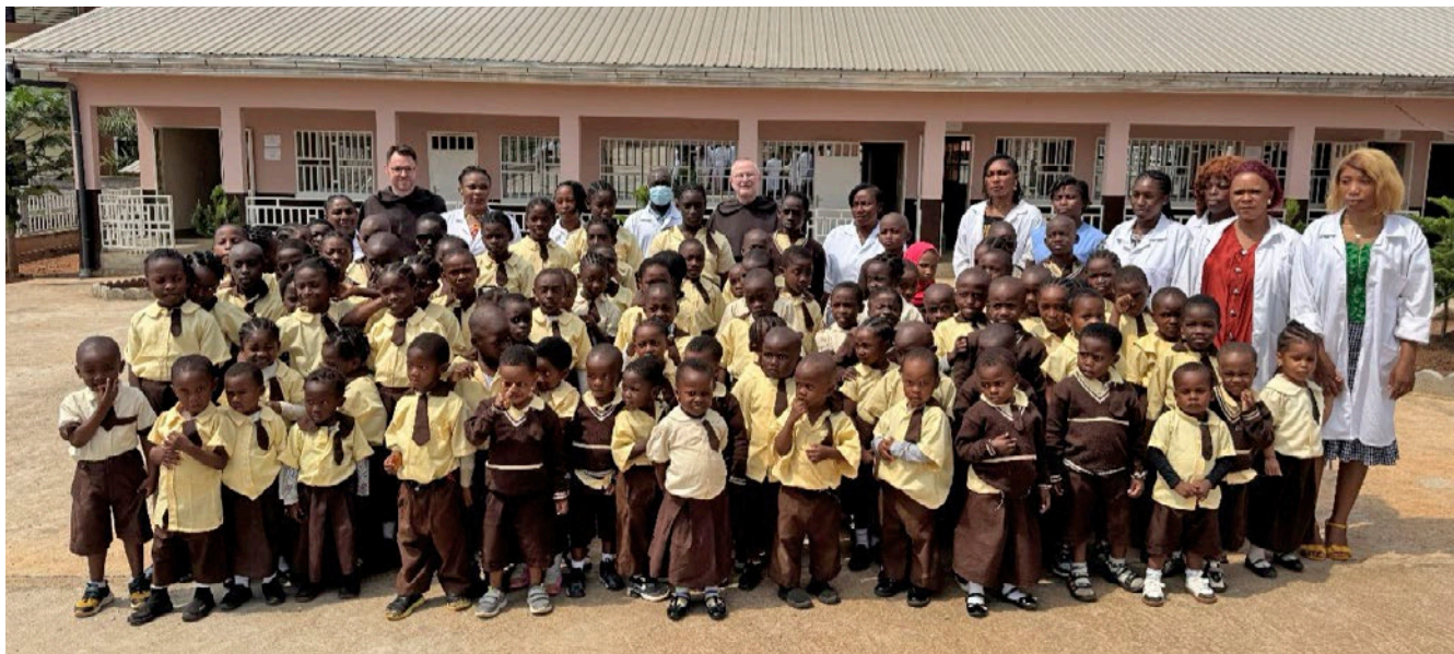
Gesamtfoto von unserem Kindergarten in Kamerun