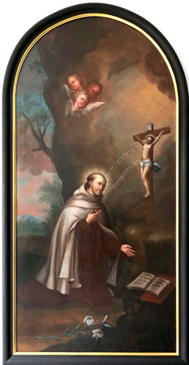
Johannes vom Kreuz im Karmelitenkloster München

ten Momenten des 14. Dezember 1591 an den Folgen eines Erysipels starb, von Anfang an von den Menschen verehrt und geliebt.