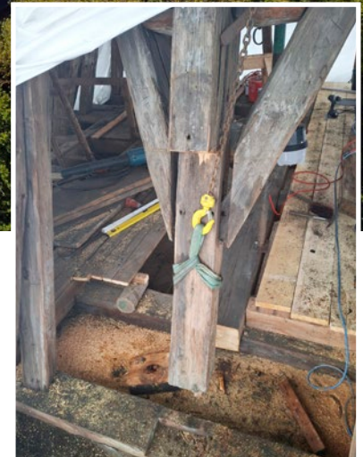
Blick in den Dachstuhl

nen. Insbesondere in den oberen Fassadenbereichen und im Umfeld des Turms war der Gerüstbau von großer konstruktiver Bedeutung. Gleichzeitig wurden bereits vorbereitende Maßnahmen für die spätere Turmsanierung mitgedacht und planerisch berücksichtigt, um einen reibungslosen Übergang zu ermöglichen.